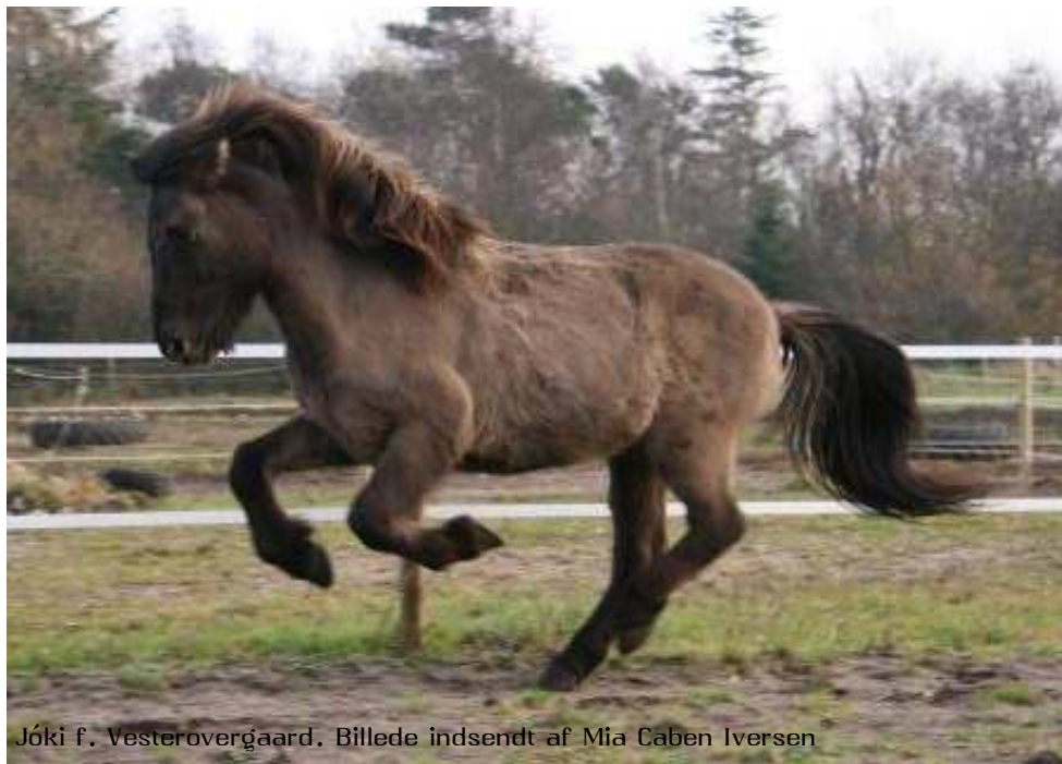
Jóki f. Vesterovergård.